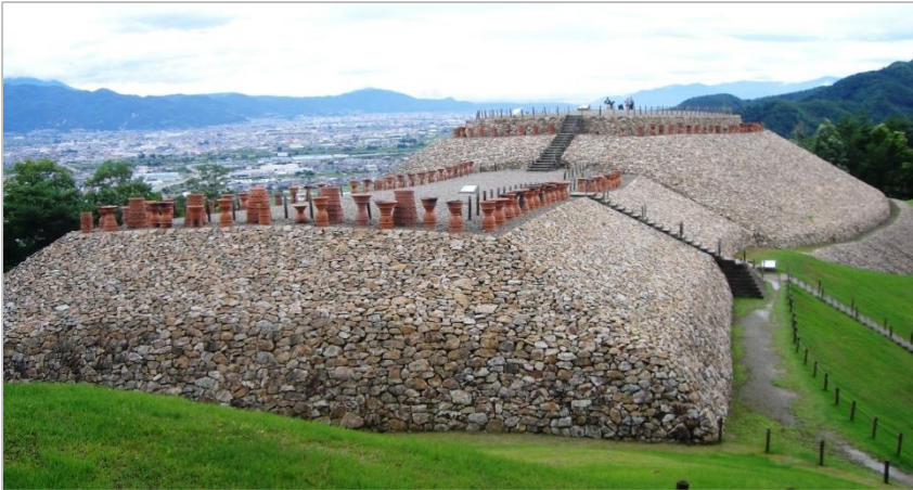
森將軍塚古墳全景

森地籍にある偉い人のお墓。 (誰のお墓かは不明) 形、大きさ、場所、材質、工法 etc. 正確に当時のままに復原 された古墳。 (昭45年)全市あげての 保存の「署名運動」 によって復原に繋がったので、 「市民みんなですった古墳」 とされています。