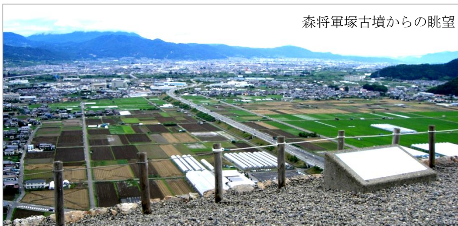
森將軍塚古墳からの眺望