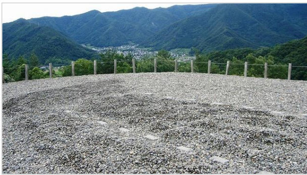
後円部の石室位置

森地籍にある偉い人のお墓。 (誰のお墓かは不明) 形、大きさ、場所、材質、工法 etc. 正確に当時のままに復原 された古墳。 (昭45年)全市あげての 保存の「署名運動」 によって復原に繋がったので、 「市民みんなですった古墳」 とされています。