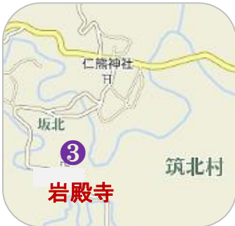
ゼンリン地図より